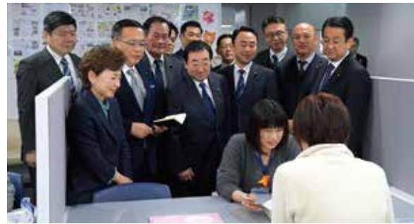
母子保健コーディネーターによる相談支援を視察

母子保健コーディネーターを全区配置! 公明党市議団は、妊娠期から子育て期における切れ目のない支援を図る、「子育て世代包括支援センター」の機能充実を訴えて参りました。 その中でも、母子健康手帳交付時の面接・相談や、個々の状況に適した情報提供等を実施し、産前産後の支援の充実を図る母子保健コーディネーターの配置拡充を要望していましたが、令和2年度予算案に新規7区含む全18区への配置を盛り込むことができました。