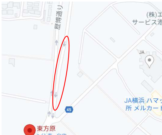
東方原交差点付近の歩道