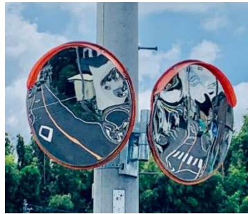
【修繕の例(東方 993) 歪んだミラーの取り換え】 (大型車両等が接触しないよう位置を上に移動)