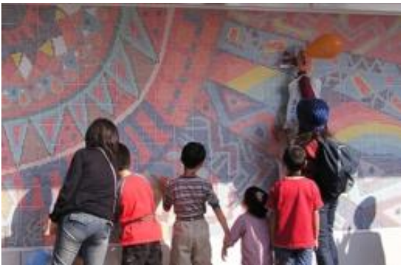
協働の事例：落書きされない壁づくりプロジェクト(都筑区)

様々な検討を加え素案ができあがり、広く市民の皆様にご意見の募集を行いました(5月6日～5月16日)。提案にあたって広く市民の皆様から戴いた貴重なご意見も盛り込み制定を目指してまいります。